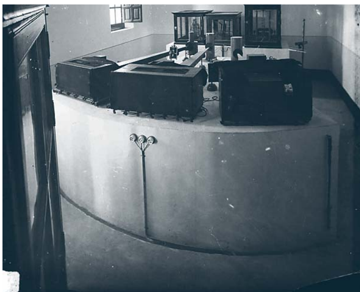
Grupo de sismógrafos magneto-ópticos