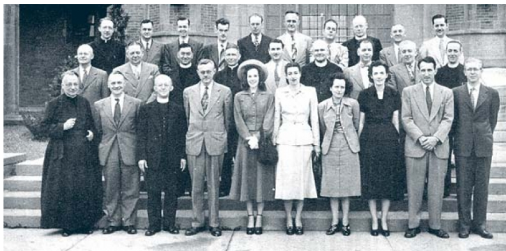
XX Reunión anual de la Sociedad Sismológica de América