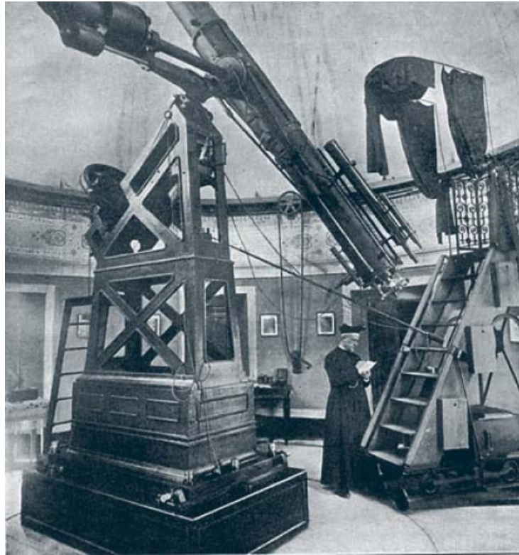
Telescopio ecuatorial Mailhat