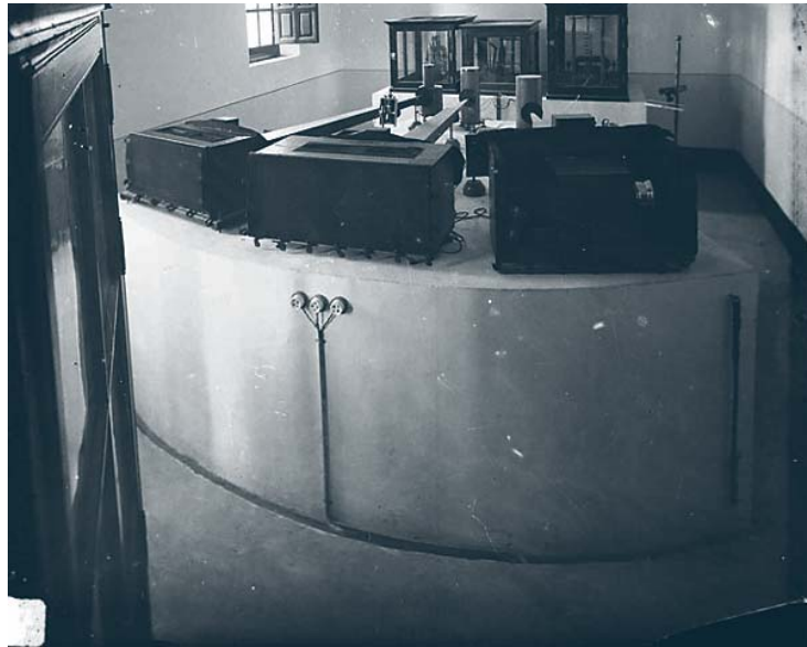
Grupo de sismógrafos magneto-ópticos