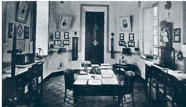
Nueva sala de meteorología del observatorio