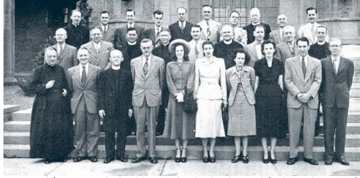
XX Reunión anual de la Sociedad Sismológica de América