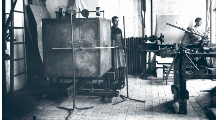
Taller Observatorio de Cartuja