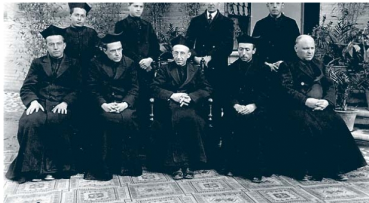
Miembros del observatorio