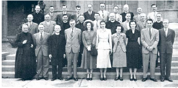
XX Reunión anual de la Sociedad Sismológica de América